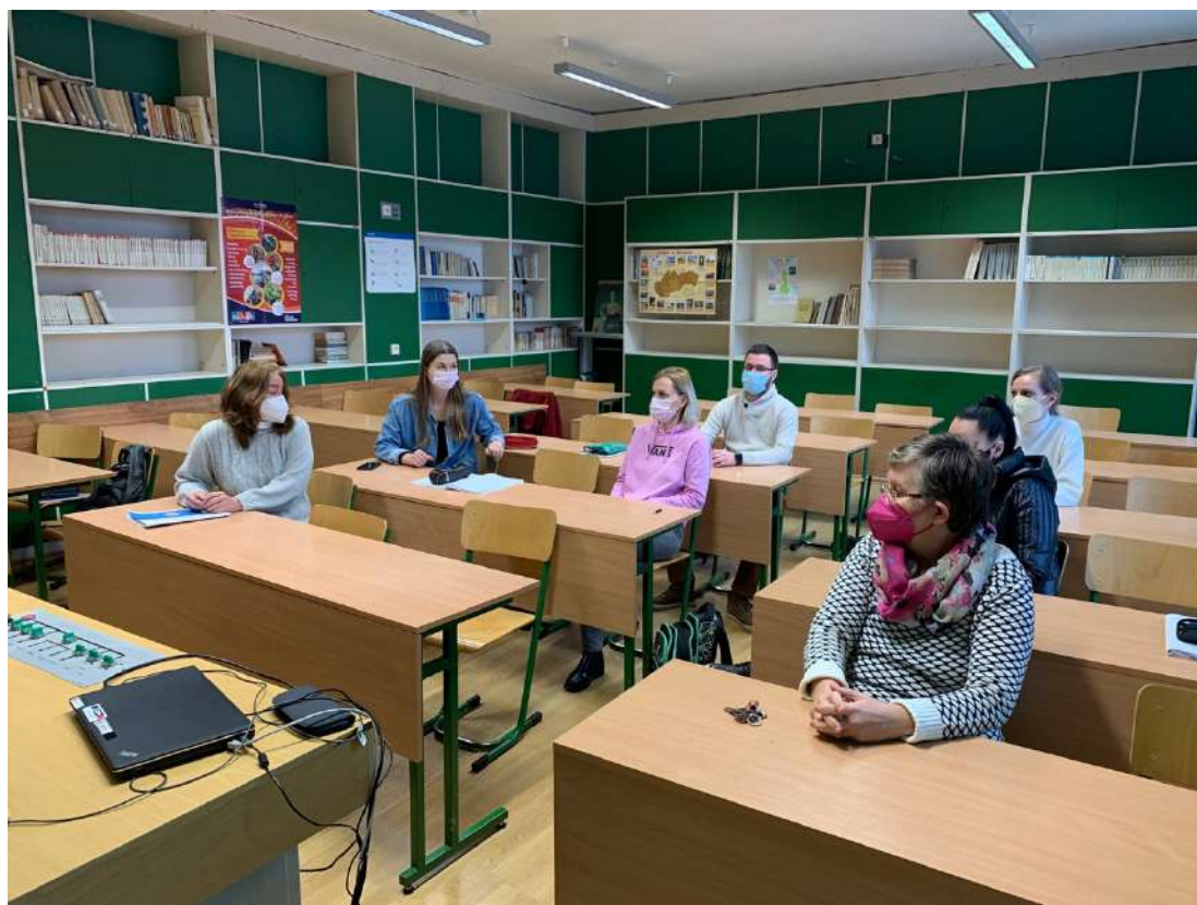
Fotky z pedagogického klubu „Úspešný absolvent humanitných predmetov“ (18.1.2022) - fotograf aj člen klubu na prvej fotke