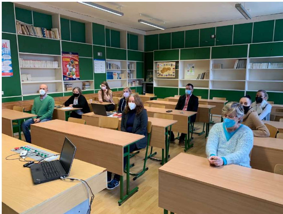
Fotky z pedagogického klubu „Úspešný absolvent humanitných predmetov“ (30.11.2021)