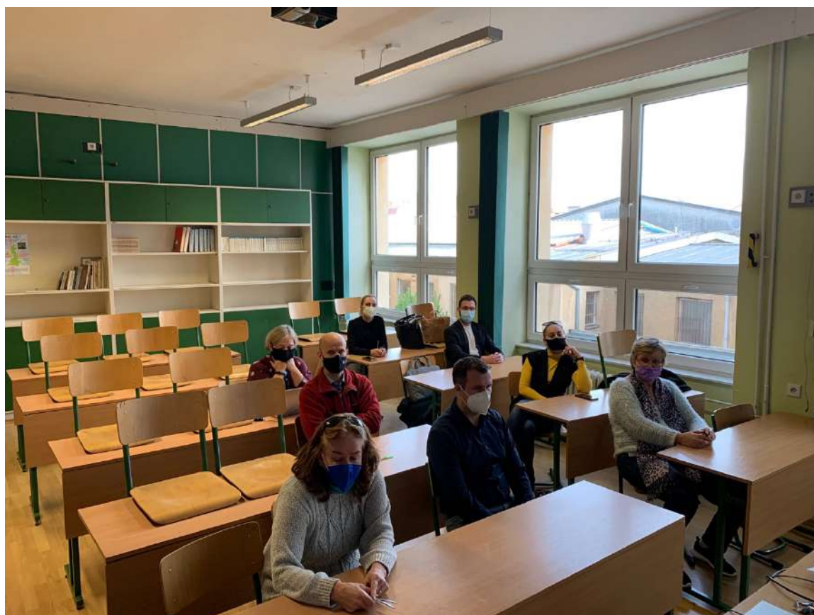
Fotky z pedagogického klubu „Úspešný absolvent humanitných predmetov“ (26.10.2021)