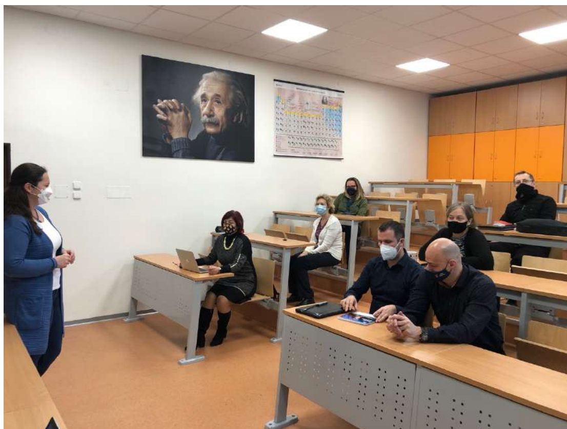
Fotky z pedagogického klubu „Úspěšný absolvent přírodovědných predmetov“ (11.1.2022)