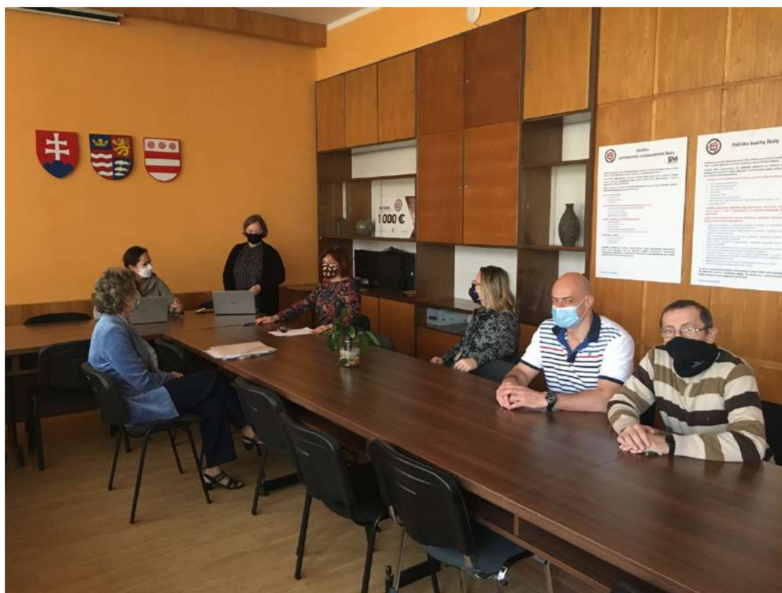
Fotky z pedagogického klubu „Úspešný absolvent prírodovedných predmetov“ (7.12.2021) – fotograf členom klubu a nie je na fotke