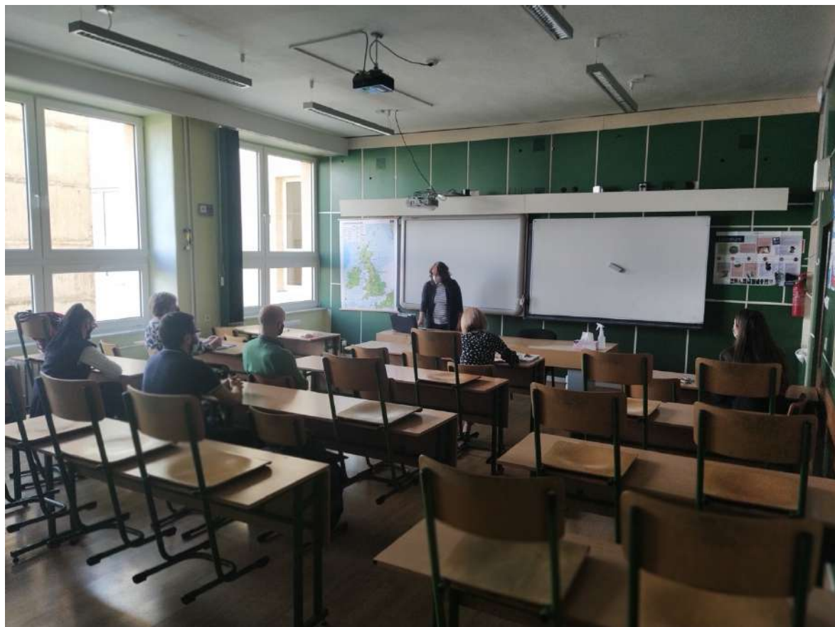
Fotky z pedagogického klubu „Úspešný absolvent humanitných predmetov“ (21.9.2021) – fotograf aj člen klubu