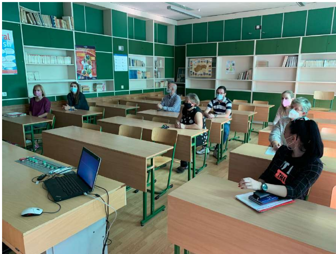
Fotky z pedagogického klubu „Úspešný absolvent humanitných predmetov“ (28.9.2021) – fotograf aj člen klubu