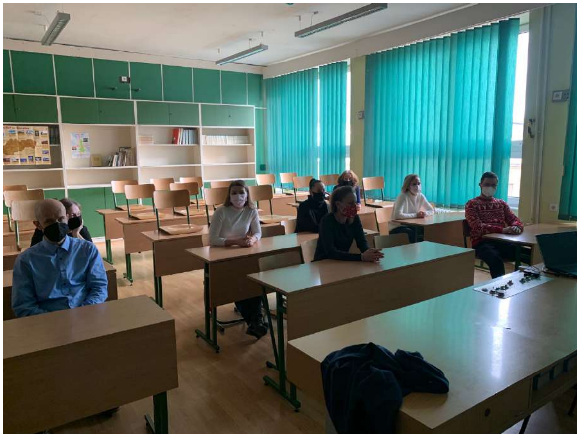
Fotky z pedagogického klubu „Úspešný absolvent humanitných predmetov“ (21.12.2021) - fotograf aj člen klubu