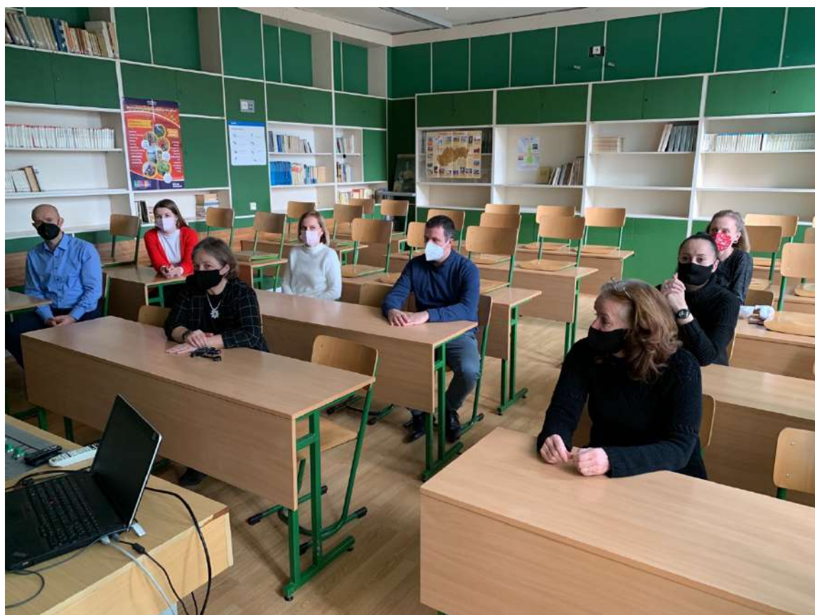
Fotky z pedagogického klubu „Úspešný absolvent humanitných predmetov“ (14.12.2021)